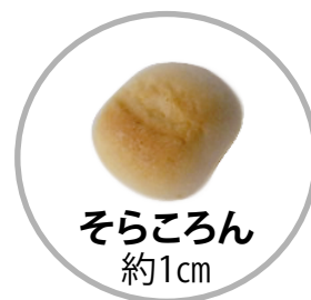
そらころん 約1 cm