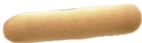
そらのしっぽ 約6 cm